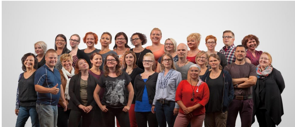
Byströmin nuorten palvelujen henkilöstöä v. 2014